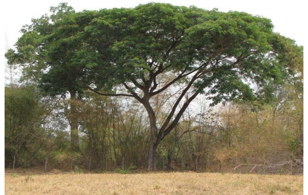
jenisero - Pithecellobium saman