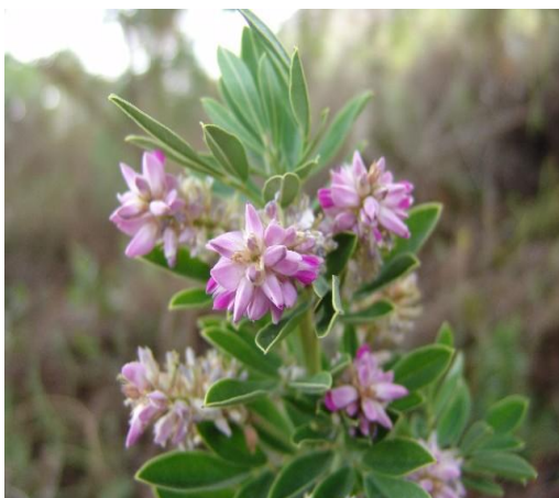
jiquilite - indigovnik - Indigofera cytoides