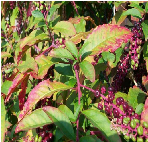
jaboncillo - ličidlo obecné (Phytolacca decandra)