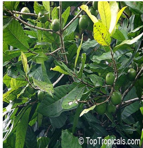
jacana (planta)- Lucuma multiflora