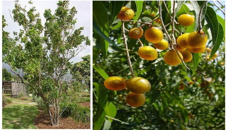
jaboncillo - sapindus saponarius - mýdlovník pravý