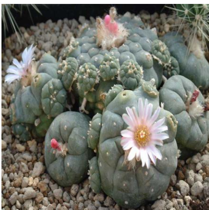
jicure - Lophophora williamsii