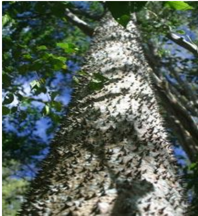
jabilla - hura chřestivá