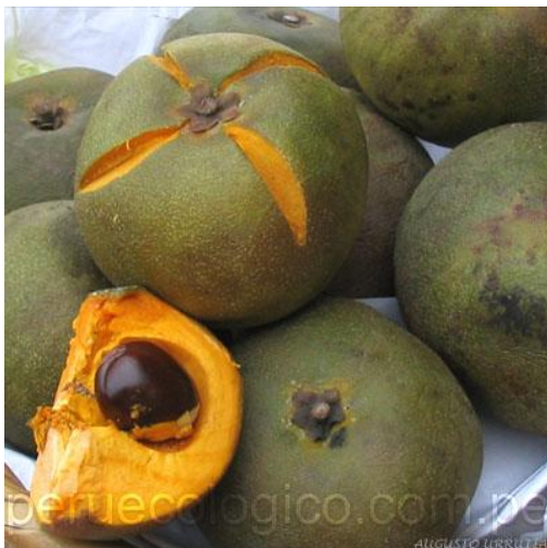
jacana (fruto)- Lucuma multiflora