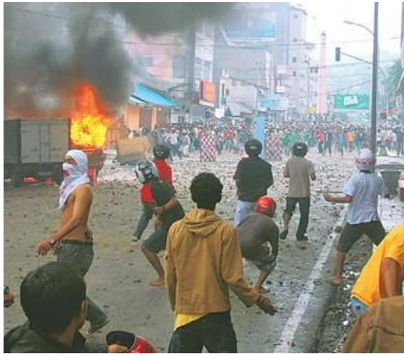
Afbeelding 17: Gevechten op Ambon januari 1999 5

De gewelddadige gebeurtenissen vormden aanleiding voor radicale islamitische organisaties op Java om aan het conflict deel te nemen. De vooraanstaande Indonesische politici wilden solidair zijn met de islamieten op de Molukken. Er werd een oproep gedaan voor een jihad, een heilige oorlog op de Molukken. 6 Er werden islamitische milities, de Laskar Jihad opgericht. De Laskar Jihad vertrok in april 2000 naar Molukken. Na de komst van jihad naar Molukken lag het initiatief vooral aan de islamitische kant. Vele zowel christelijke als ook islamitische dorpen werden totaal vernietigd.