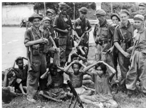
Afbeelding 4: Nederlandse soldaten tijdens de tweede politionele actie 12

Nederland kreeg een financiële steun van de VS voor de wederopbouw na de Tweede Wereldoorlog. Deze financiële hulp kwam door het Nederlands-Indonesische conflict in gevaar. De VS hadden ook zorgen dat als de oorlog in Indonesië zou voortgaan, de communisten in Indonesië meer macht zouden kunnen krijgen. Nederland had geen andere mogelijkheid dan de strijd te staken en de Indonesische regering vrij te laten. 13 In augustus 1949 kwam er een staakt-het-vuren. Op 27 december 1949 werd de soevereiniteit tijdens de Ronde-Tafelconferentie (RTC) in het Paleis op de Dam in Amsterdam aan de Verenigde Staten van Indonesië (VSI) overgedragen. 14