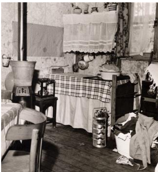
Afbeelding 10: Een kamer in een Moluks woonoord 16

Sommige barakken waren van hout gemaakt. Het was daar koud en vochtig. Voor de Molukkers die aan een ander klimaat gewend waren was het niet gunstig. De koude en vochtigheid hebben vaak ziektes veroorzaakt. Elk gezin had meestal één kamer. De meeste gezinnen waren zeer kinderrijk en dat betekent dat er flink moest worden gewoekerd met de ruimte.