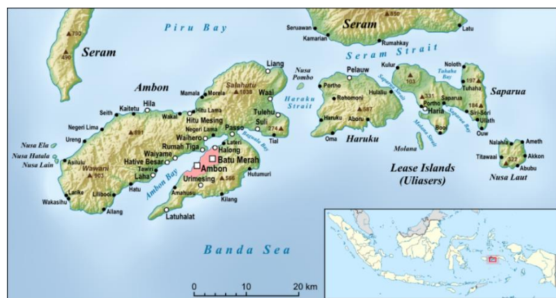
Afbeelding 2: De kaart van Ambonese eilanden 6

Aan het begin van de zeventiende eeuw waren de Ambonese eilanden in twee delen verdeeld. Aan de ene kant was een islamitisch deel waartoe de noordkust van Hitu, Hoamoal, het noordelijk deel van het eiland Haruku en het noordelijk deel van Saparua behoorden. Aan de andere kant stond een christelijk deel bestaande uit de zuidkust van Hitu, het schiereiland Leitimur, het zuidelijk deel van de eilanden Haruku en Saparua en het kleine eiland Nusa Laut. De belangrijkste medestander van het islamitische deel waren de handelaren van Java en de moslims van Ternate.