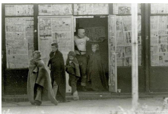
Afbeelding 14: Kinderen met gijzelnemer, Bovensmilde 1977 17

Van 94 passagiers werden 40 personen vrijgelaten. Het ging om oude mensen en mensen van niet-Nederlandse afstamming. In de school in Bovensmilde is een epidemie uitgebroken. Daarom werden na drie dagen bezetting alle kinderen vrijgelaten.