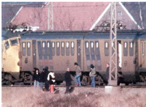
Afbeelding 13: 14 december 1975, Wijster-Molukse kapers verlaten de trein 15