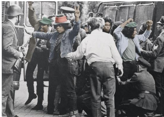
Afbeelding 12: Protesterende Molukse jongeren 10