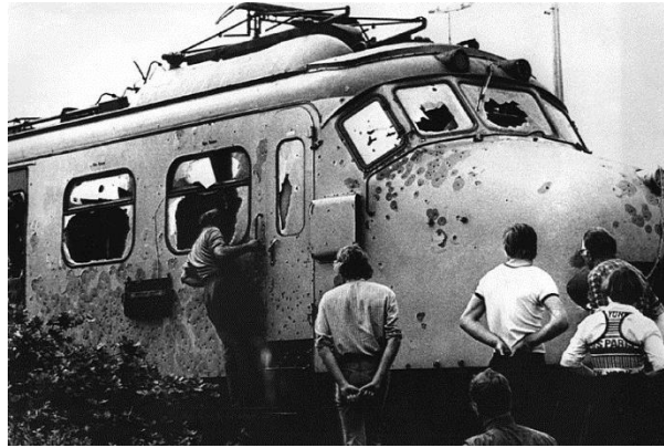
Afbeelding 15: De trein na de aanval 18

veroveren. Dat gebeurde op 11 juni 1977. Deze aanval kostte twee gijzelaars en zes kapers het leven.