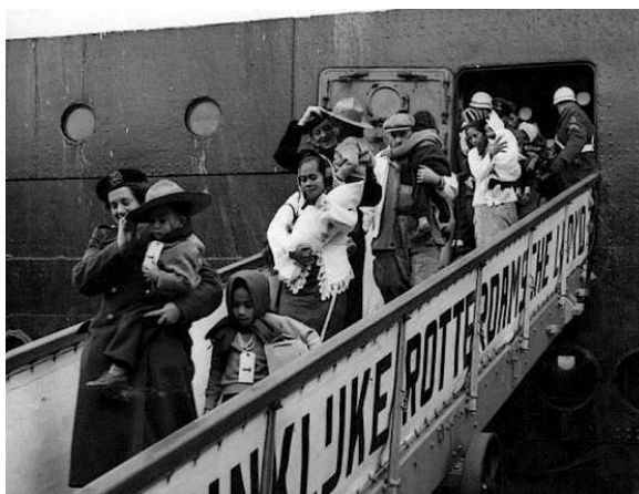
Afbeelding 9: Aankomst van Molukkers op 21 maart 1951 12

kinderen geboren. 11 Bij de komst van Molukkers viel er geregeld natte sneeuw, waaide een koude wind en de temperatuur was slechts een paar graden boven het vriespunt. Hoewel de Molukse vrouwen en kinderen militaire trainingspakken hadden gekregen, rilden ze van de kou.