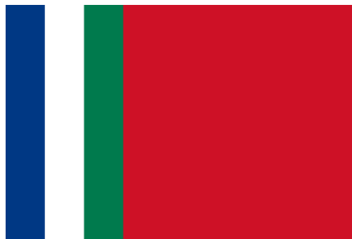
Afbeelding 8: Vlag van de RMS 8

De nieuwe leiders van RMS waren vooral christenen. Manuhutu werd de president van RMS, Soumokil werd minister van Buitenlandse Zaken en het ministerie van Onderwijs kwam in handen van Manusama. De RMS leiders waren bijna allemaal afkomstig van Ambon en vlakbij liggende eilanden. De zuidelijke eilanden hadden in nieuw kabinet slechts één afgevaardigde. 7