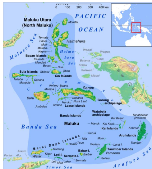
Afbeelding 1: De kaart van Molukken 3

De Molukken zijn een eilandengroep die in het oosten van Indonesië ligt. Deze eilanden zijn in drie regio's verdeeld: de Noord-Molukken met de eilanden Ternate, Tidore en het aangrenzende gebied; de Banda-eilanden met het aanliggende gebied van Zuidoost-Seram en de zuidelijke eilanden; en de Midden-Molukken waarbij het eiland Ambon en het aanliggende gebied behoort. 1 Administratief zijn de eilanden verdeeld in twee provincies, namelijk de Zuid-Molukken ( Maluku Selatan ) met Ambon als hoofdplaats en Noord-Molukken ( Maluku Utara ) met Ternate als hoofdplaats. De hele eilandengroep bestaat uit 1.027 eilanden waarvan meer dan de helft onbewoond is. 2