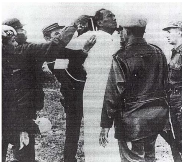
Afbeelding 11: Executie van Soumokil 4

Op 12 april 1966 werd de RMS leider Soumokil geëxecuteerd. Zijn vrouw en zoon kwamen naar Nederland, waar intussen onder leiding van Joop Manusama een regering in ballingschap was gevormd. De executie van Soumokil leidde tot radicalisering van veel Molukse jongeren in Nederland.