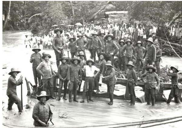
Afbeelding 3: Ambonese KNIL-militairen tijdens het verzet op Ambon 5

Het Moluks verzet speelde tijdens de Japanse bezetting een belangrijke rol. Zoals gezegd ging het vooral om de christelijke Molukkers die vaak tot de onmisbare militairen van het KNIL behoorden. Ze hebben verschillende verzetsgroepen opgericht en hebben zich tegen de Japanners verzet.