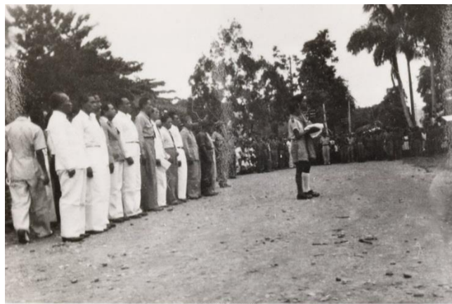
Afbeelding 5: Proclamatie van de RMS op 25 april 1950 5

Op 25 april 1950 werd de onafhankelijkheidsverklaring voorgelezen op Radio Ambon. Vaak werd er gesproken over de vraag of de Molukkers het recht hadden uit het Indonesische staatsverband te treden. Formeel hadden er de democratische verkiezingen moeten plaatsvinden.