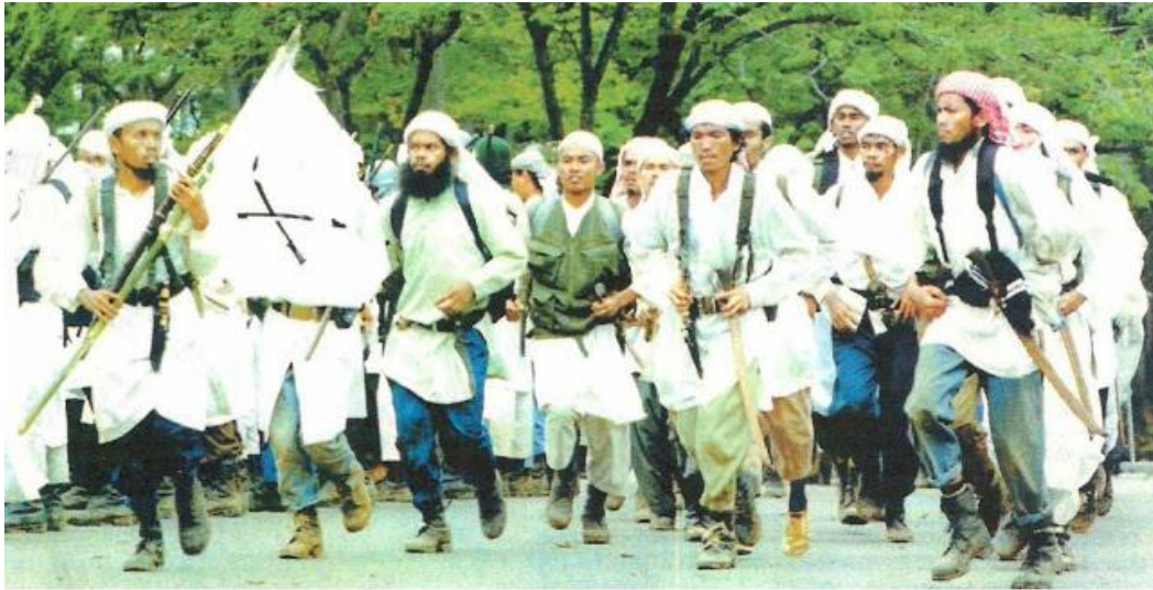
Afbeelding 18: Laskar Jihad op Ambon 7

Jihad noch het FKM waren bij het vredesakkoord aanwezig. Na het vredesakkoord kwamen er nog bomaanslagen en bloedige aanslagen in de stad Ambon.