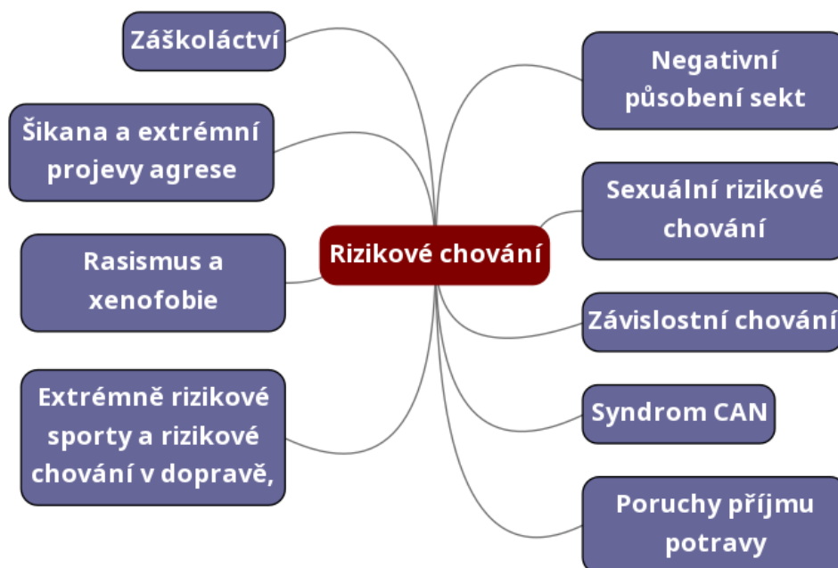
Graf č. 2 Klasifikace rizikového chování (Miovský, 2010, s. 24)

MIOVSKÝ (2010, s. 24) klasifikuje rizikové chování podle typů: