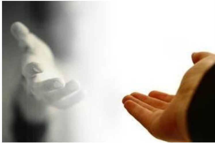
Obrázek č. 1 Pomocná ruka

„Mám pocit, že kolem nás je čím dál víc neslušnosti, egoismu a lhostejnosti. Mně to vadí. A tak se snažím takový nebýt.“