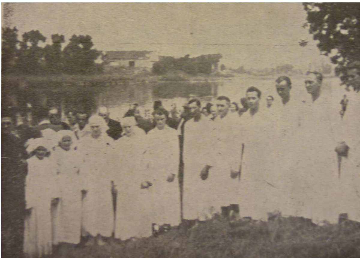
Křest v Labi, Lovosice, 1951.