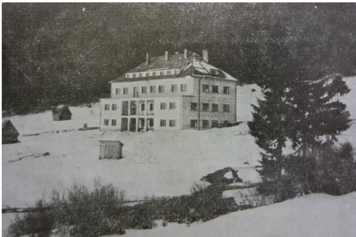
Konferenční a misijní středisko Račkova dolina, Slovensko, 1948.