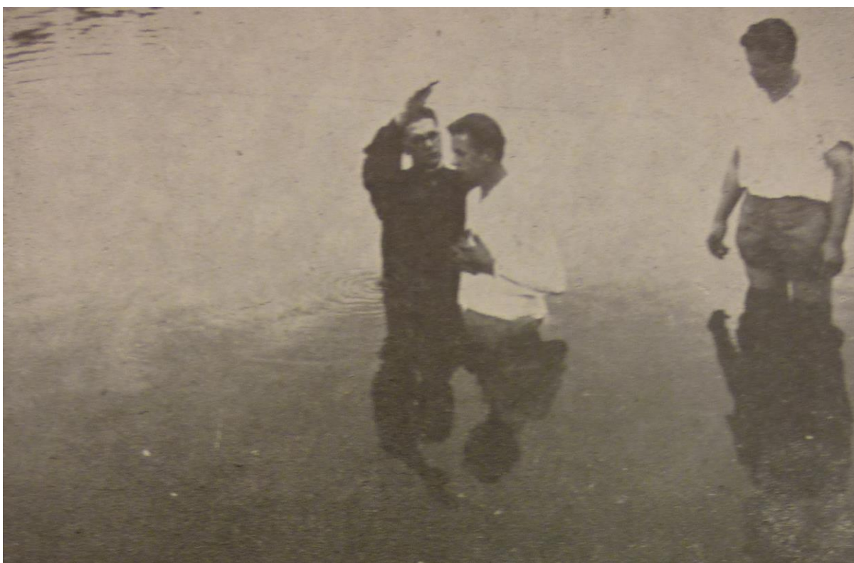
Křest v Labi, Lovosice, 1951.