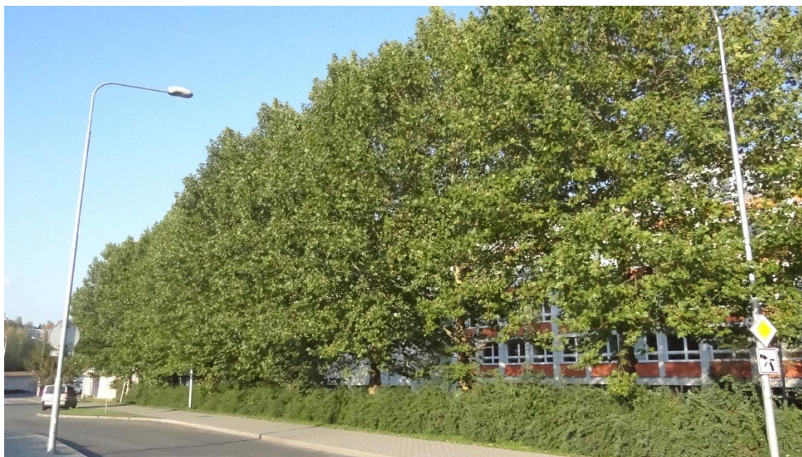
Obr.3: Stromořadí javorů na ulici Pionýrů

Kromě alejí je významná také doprovodná zeleň podél řeky Ostravice. Ta je tvořena hlavně vrbami, olšemi a jasaný.