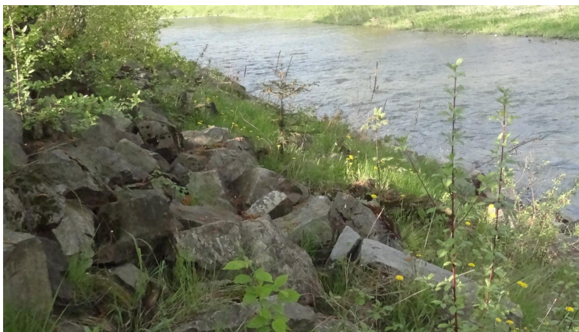
Obr. 4: Neudržovaná plocha v okolí Ostravice (I. Petrželková, 5.5.2013)

V rámci zájmového území ve městě Frýdek-Místek jasně převažují travnaté porosty a stromy. Ty tvoří dohromady 93,2 % z alergenních zón v oblasti. Výskyt keřů je poměrně malý, nejvíce jich nalezneme v okolí dětských hřišť a významějších silnic. Okolí řeky Ostravice patří k neudržovaným plochám mapovaného území, je zde proto zvýšený výskyt rostlinných alergenů. Zastoupení jednotlivých typů alergenních zón můžeme vyčíst z mapy 2.