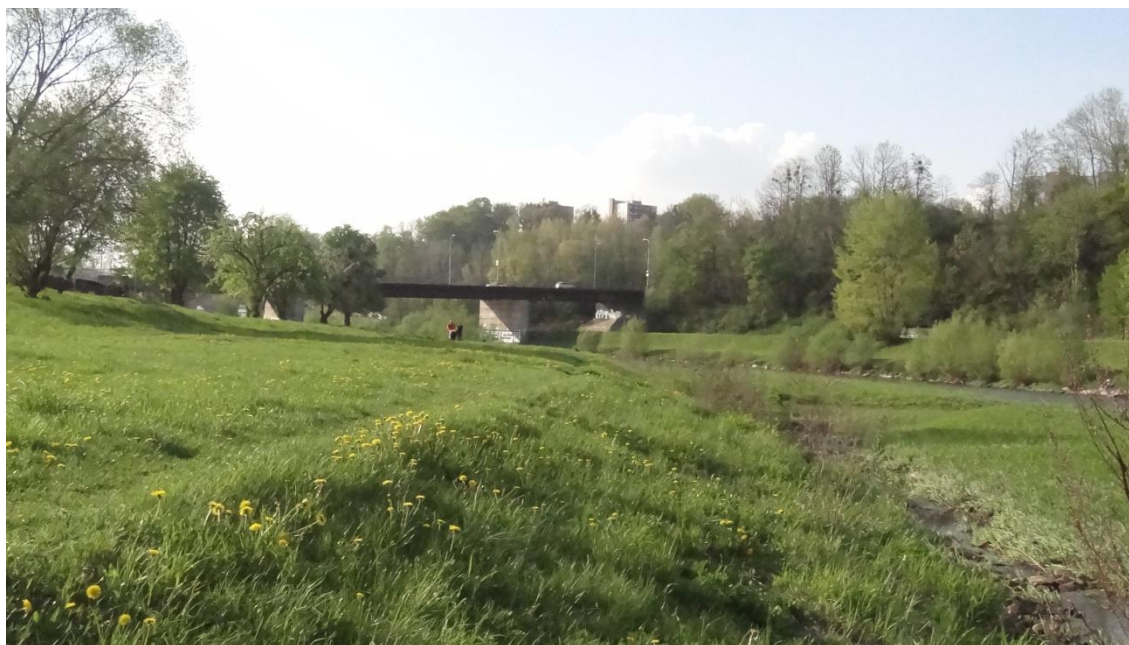
Obr.2: Travnatá plocha v okolí řeky Ostravice (I.Petrželková, 5.5.2013)

Kategorie obsahuje travnaté plochy, které se vyskytují pravidelně v celém mapovaném území. Tvoří 52,73 % ze všech alergenních zón a zároveň zaujímají 17 % z celkového mapovaného území. Celková rozloha zájmového území je 49,2 m 2 . Jedná se převážně o traviny s lokálním výskytem smetanky lékařské. Plochy jsou pravidelně udržovány, přesto se však může při chybném načasování seče vyskytnout problém v podobě kvetoucích trav, případně dvouděložných rostlin. Travníky jsou udržovány pouze sečením bez dalších úprav omezujících výskyt rizikových rostlin. Na travnatých plochách tedy můžeme narazit na výskyt smetanky lékařské, sedmikrásky chudobky či jiných rudерálních společenstvech (kokoška, merlík, lebeda, kopřiva, podběl, aj.).